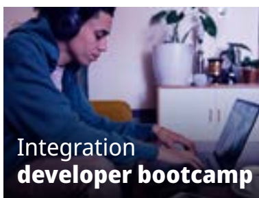
Integration developer bootcamp

Experimente um aprendizado imersivo e interativo por meio de nossos programas de treinamento conduzidos por instrutores. Envolve-se diretamente com instrutores experientes e beneficie-se do conhecimento deles ao explorar os cursos.